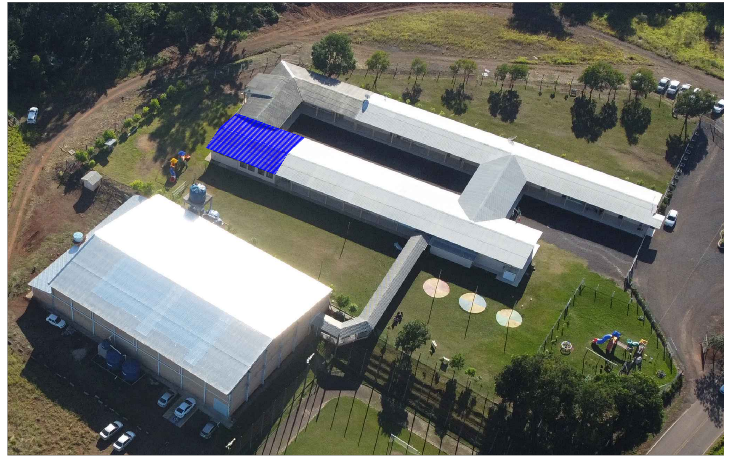
TELHADO DEMARCADO Imagem aérea Sem escala