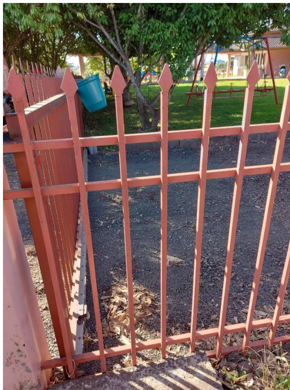
Imagem 01 – Cerca Existente